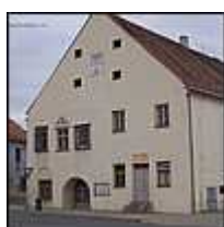
náměstí v Hostěradicích

Na konci pozdní doby kamenné zde zakládal sídliště lid kultury se zvoncovitými poháry asi 2500-2000 př.n.l., který osídlil většinu území západní a střední Evropy. Z této doby se našly Žárové hroby a to na jihozápadním okraji dnešního městečka v okolí zemědělského areálu. Z doby následující starší doby bronzové 2000-1550 př.n.l. se našlo pohřebiště v poloze Langes Feld - dnešní polní trať Dlouhé pole u Míšovic. Vedla tudy i pravěká obchodní stezka, o čemž svědčí významný nález skladu bronzů z pole Schrankenfeld dnešní polní trať Za vrbákem. První historicky známé etnikum - Keltové z mladší doby železné 450 př.n.l. - 0 založili sídliště v trati Dolní malé pole u Chlupic. Pocházejí odtud typické nádoby a části železných nástrojů. V době římské 0 - 380 n.l. osídlily toto území germánské kmeny. Nálezy z doby tzv. stěhování národů nejsou doloženy.