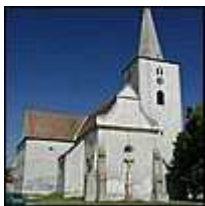
kostel sv. Kunhuty

V době působení řádu byla postavena raně gotická kaple a bylo započato se stavbou špitálu, komendy a se stavbou farního kostela sv. Kunhuty. Ve 2. polovině 15. století byly Hostěradice a jejich okolí nejednou "navštíveny" bojujícími vojsky českých králů Jiřího z Poděbrad a Matyáše Hunyadiho a jejich spojenců. Majitel Moravskokrumlovského panství, spojenec krále Jiřího z Poděbrad, po marném obléhání Drnholce v roce 1468 musel ustoupit před vojsky lichtenštejnskými do opevnění kostelního souboru a dvorce v Hostěradicích.