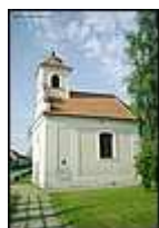
kostel v části Míšovice