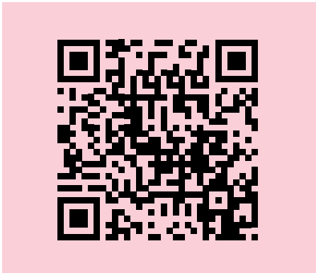
Odkaz na video z předání pomoci Autor: Petr Dostál