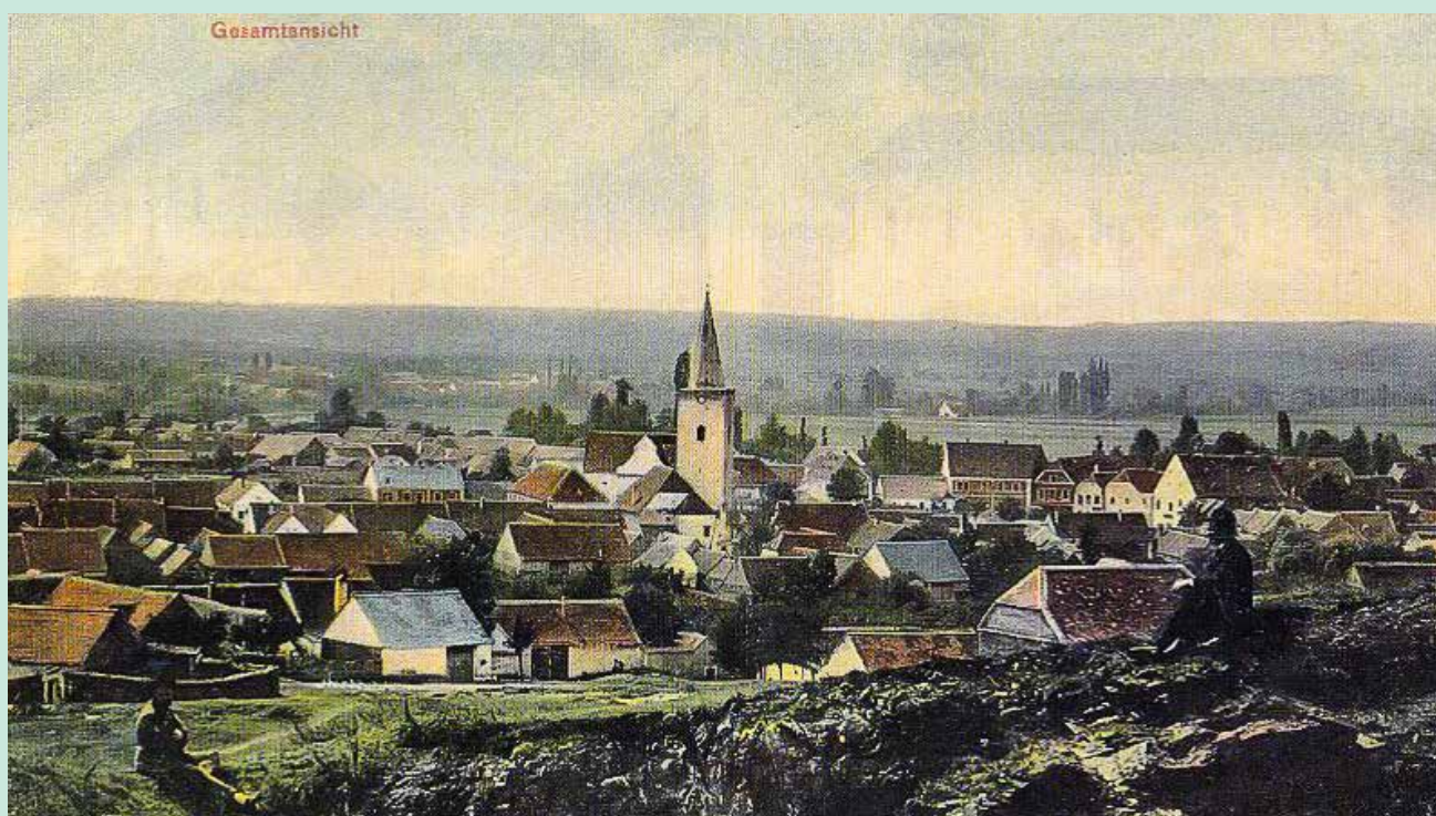
Pohled na Hostěradice z roku 1905